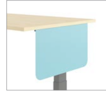
Seitenblende aus Stahl