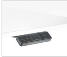
Bedienelement mit 4-fach Memory