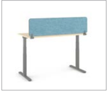
Sichtschutz oberhalb des Tisches

Divisio und Partito Screens und Trennwände in verschiedenen Konfigurationen können als Sichtschutz oder Blenden zum Einsatz kommen. Die Knieraumblende aus Stahl sowie die Seitenblende aus Stahl sind exklusiv nur für Migration SE erhältlich