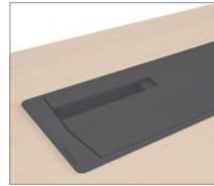
Kabeldose aus Kunststoff