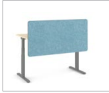
Sichtschutz oberhalb + unterhalb des Tisches