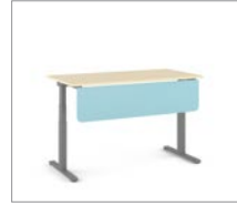
Knieraumblende aus Stahl