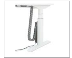
Vertikaler Kabelkanal + Kette